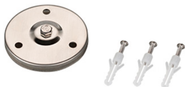
Рисунок 1. Основание для установки на поверхность (арт. 024890).