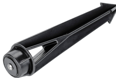
Рисунок 2. Основание для установки в грунт (арт. 024888).